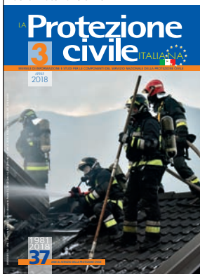
V.V.F. Volontari del Trentino

Mensile di informazione e studi per le componenti del Servizio nazionale della Protezione civile, fondato nel 1981 sotto l'alto Patrocinio del Ministro per il Coordinamento della Protezione civile