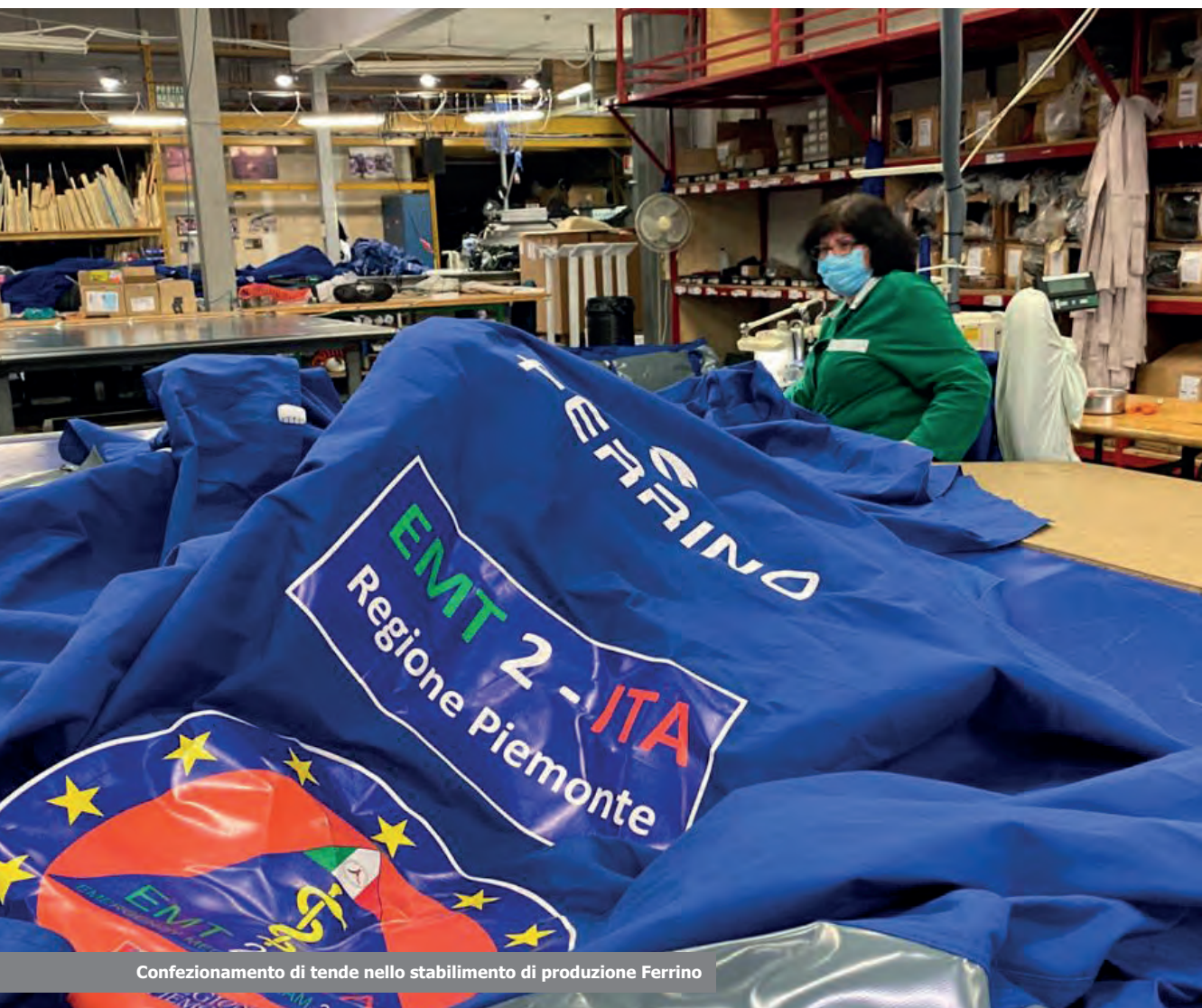
Confezionamento di tende nello stabilimento di produzione Ferrino

ti sull'emergenza per soddisfare rapidamente le richieste che arrivano dalle organizzazioni impegnate nell'emergenza. La produzione interna è rimasta costantemente operativa per il confezionamento delle tende che sono state impiegate all'esterno degli ospedali per effettuare un primo screening (triage) sui pazienti che arrivano al Pronto Soccorso, così da poterli incanalare nei giusti flussi d'accesso alla struttura ospedaliera.