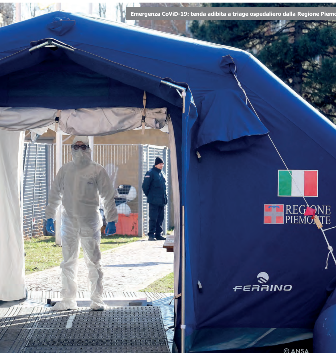
Emergenza CoViD-19: tenda adibita a triage ospedaliero dalla Regione Piemonte

Durante la fase più critica della pandemia tutti gli sforzi dell'azienda si sono concentra-