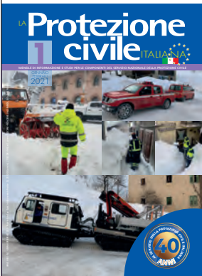
le nevicate estreme di metà gennaio

Mensile di informazione e studi per le componenti del Servizio nazionale della Protezione civile, fondato nel 1981 sotto l'alto Patronato del Ministro per il Coordinamento della Protezione civile