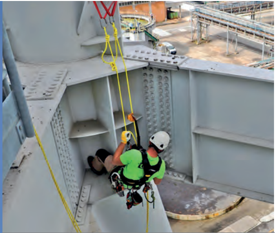
Attrezzature e know how per interventi su fune nel comparto edile, industriale e nella sicurezza in quota: il core business di NGsafety