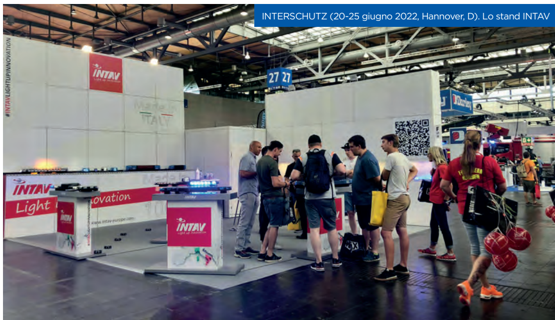
INTERSCHUTZ (20-25 giugno 2022, Hannover, D). Lo stand INTAV

Una strategia che si è rivelata un’arma vincente soprattutto quest’anno “dove la gestione interna delle materie prime ha rappresentato la chiave di volta per affrontare l’unicità del contesto odierno e dei cambiamenti del mercato”.